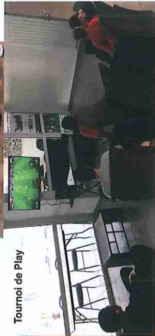
Tournoi de Play