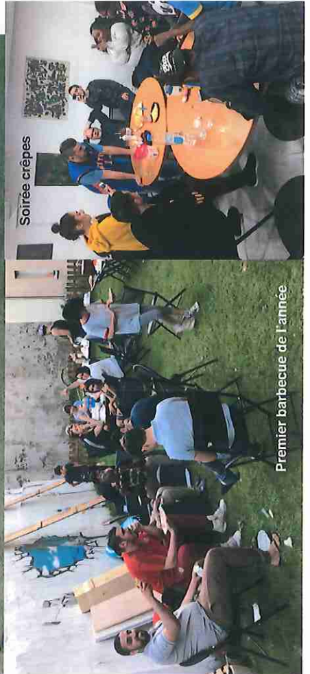
Premier barbecue de l'année