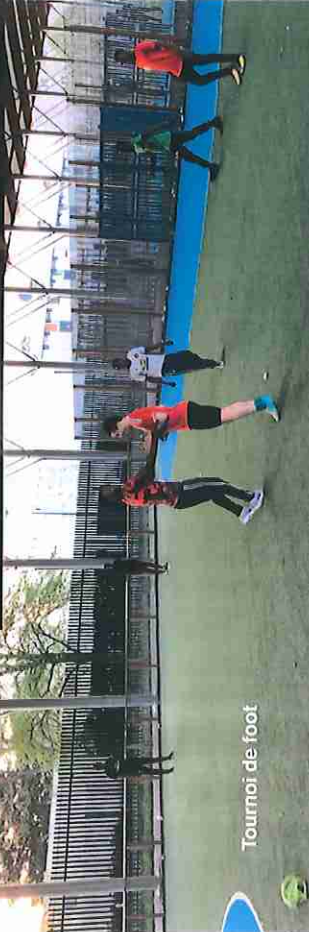
Tournoi de foot