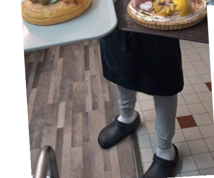
Atelier pâtisserie animé par Niara