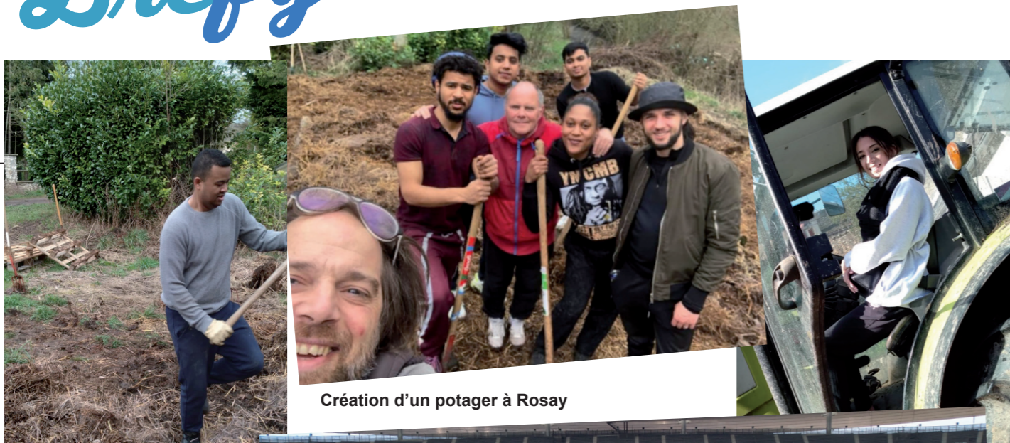
Création d'un potager à Rosay