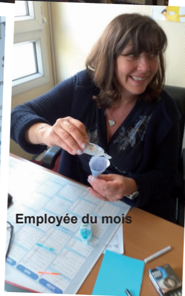
Employée du mois