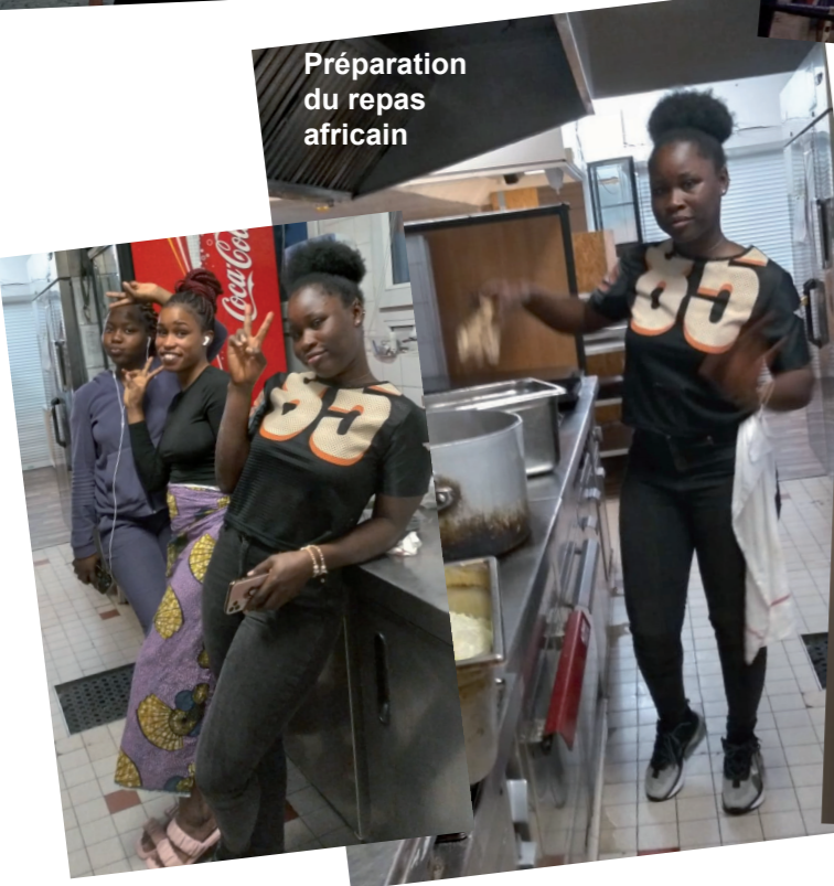
Préparation du repas africain