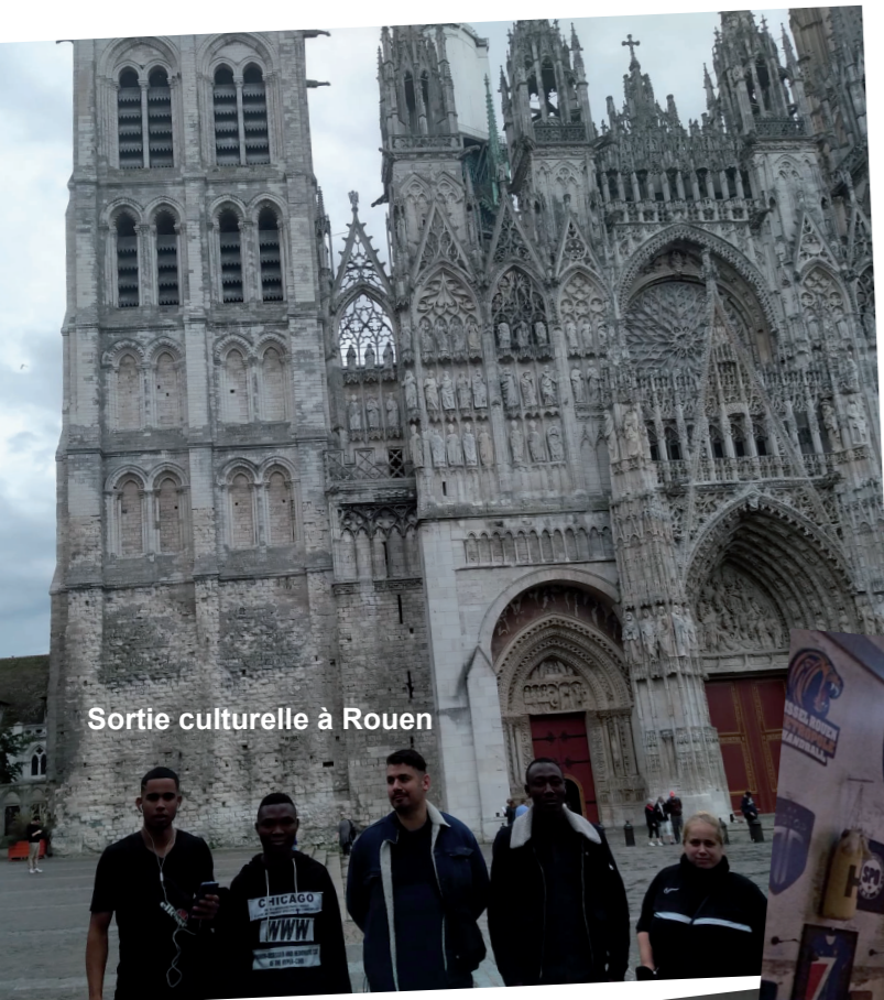
Sortie culturelle à Rouen